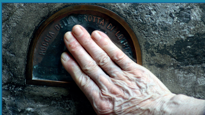
Targhetta Grotta delle Apparizioni