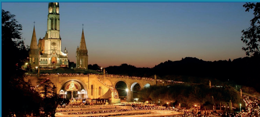
Santuario di Lourdes