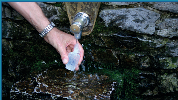
Fontana Acqua benedetta