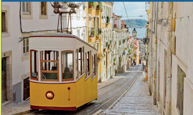
Tram caratteristico di Lisbona