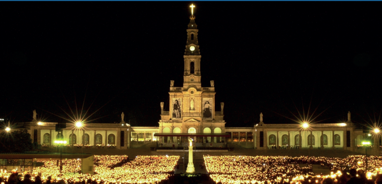
Santuario di Fatima