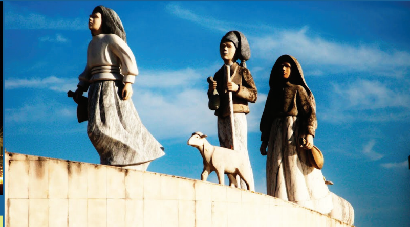
Monumento 3 pastorelli